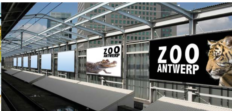
Communication en magasin - textile