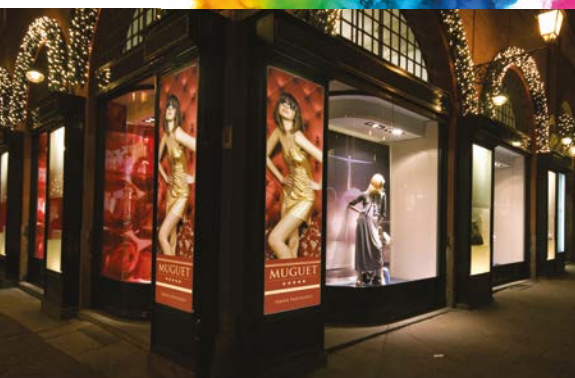
Communication en magasin - vinyle auto-adhésif