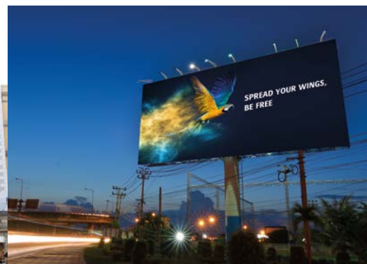
Encres dédiées pour les applications en intérieur/extérieur