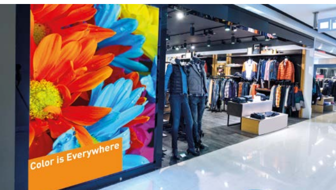
Communication en magasin - vinyle auto-adhésif

L'Anapurna RTR3200i LED plus blanc fonctionne avec la dernière génération d'encres blanches d'Agfa, qui offrent la particularité d'être très opaques. Ainsi, vous obtenez des impressions blanches de qualité avec une faible consommation d'encre sur des substrats colorés ou noirs, de même que sur des matériaux transparents pour les applications rétroéclairées ou éclairées par l'avant. Sinon, vous pouvez utiliser le blanc simplement comme une couleur d'accompagnement. En outre, l'Anapurna RTR3200i LED plus blanc permet d'imprimer un blanc de préparation et/ou un blanc de soutien simultanément dans un cycle de production, ce qui élargit considérablement les possibilités d'application.