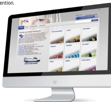
Solution de Web to Print StoreFront

L'interface utilisateur d'Asanti fonctionne avec une visualisation poussée de la mise en forme des visuels et de leurs positionnements : les opérateurs peuvent ainsi voir très précisément ce qu'ils impriment. L'interface graphique propose un accès direct aux paramètres d'impression clés pour s'assurer que tout changement de dernière minute soit rapide et facile à appliquer. La préparation des tâches a lieu indépendamment des opérations de l'Anapurna, grâce à l'infrastructure client-serveur. Cela complète à la perfection le mode autonome de la machine, permettant aux opérateurs de ne pas être contraints de rester près de la machine, lorsque d'autres tâches ou obligations exigent leur attention.