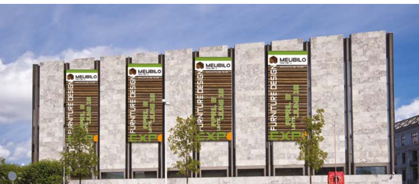
Communication extérieure - textile