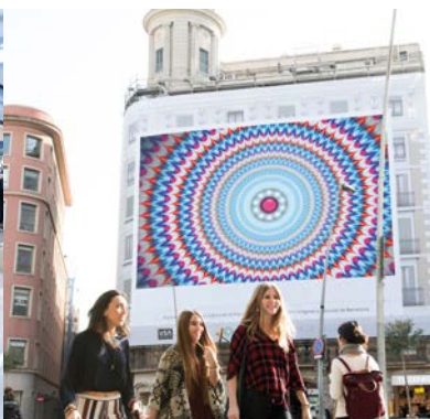
Communication extérieure - rétroéclairée