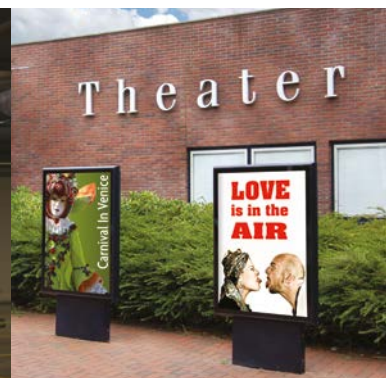
Encres dédiées pour les applications en intérieur/extérieur