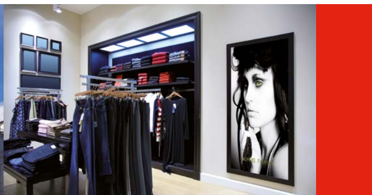
Communication en magasin - textile