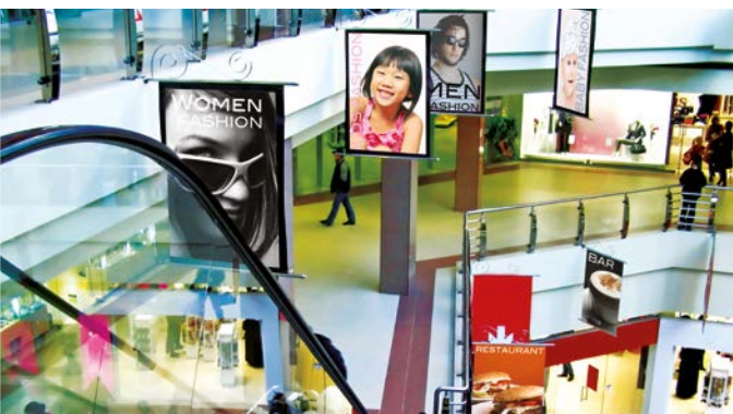
Communication extérieure - textile

Imprimante à la fine pointe de la technologie optimisée par Asanti, l'Anapurna RTR3200i LED s'intègre parfaitement avec PrintSphere, un autre service Cloud d'Agfa qui permet d'automatiser la production, de partager facilement des fichiers et de stocker les données en toute sécurité. Ce service dans le Cloud intégrable offre la possibilité aux professionnels de l'impression d'automatiser leurs flux de production et de faciliter l'échange des données avec leurs clients, collègues, travailleurs indépendants, ou avec d'autres services et d'autres solutions proposées par Agfa.