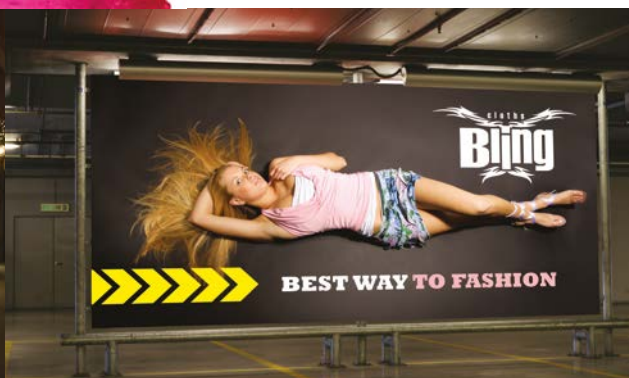
Communication extérieure - rétroéclairée